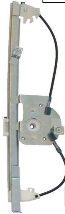
Ns meccanismo SX