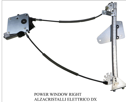
POWER WINDOW RIGHT ALZACRISTALLI ELETTRICO DX

THIS INSTALLATION INSTRUCTION IS FOR BOTH LEFT AND RIGHT SIDE. CETTE INSTRUCTION DE MONTAGE EST POUR LES DEUX COTES DROIT ET GAUCHE. DIESE MONTAGE-ANLEITUNG IST FÜR DIE BEIDE LINKE UND RECHTE SEITE. ESTA INSTRUCCION DE MONTAJE ES PARA LOS DOS LADOS IZQUIERDO Y DERECHO. ESTAS INSTRUÇÕES VALEM TANTO PARA O LADO ESQUERDO QUANTO PARA O DIREITO. DEZE AANWIJZINGEN GELDEN VOOR ZOWEL DE LINKER- ALS DE RECHTERKANT. Η ΠΑΡΟΥΣΑ ΟΔΗΓΙΑ ΑΦΟΡΑ ΤΟΣΟ ΤΗΝ ΑΡΙΣΤΕΡΗ ΟΣΟ ΚΑΙ ΤΗ ΔΕΞΙΑ ΠΛΕΥΡΑ. LA PRESENTE ISTRUZIONE VALE SIA PER IL LATO SINISTRO CHE PER IL LATO DESTRO.