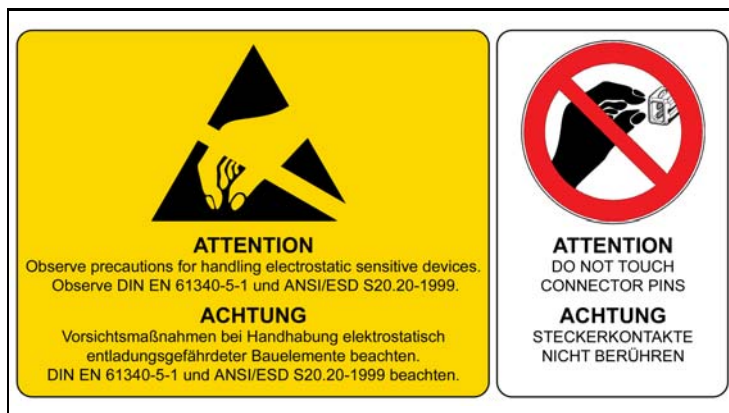
4 - ESD Hinweise / ESD Notes