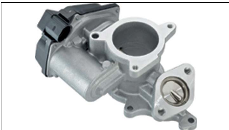
1 - Produkt / Product