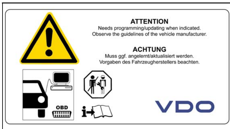
3 - Montage Hinweise / Installation Notes

Nennspannung (Positionssensor) / Nominal Voltage (Position Sensor) = 5 V