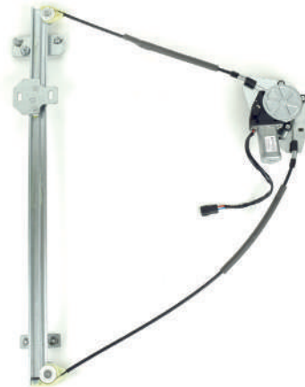
Nuestro Elevalunas / Our window regulator / Notre lève-vitre / Nosso elevador de vidro