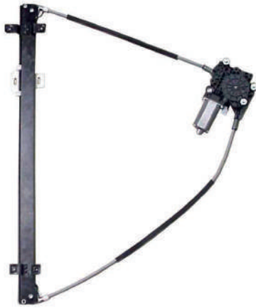
Elevalunas original / OEM window regulator / Lève-vitre original / Elevador de vidro original

Elevalunas Eléctrico Power Window Regulator Lève-vitre Électrique Elevador Elétrico