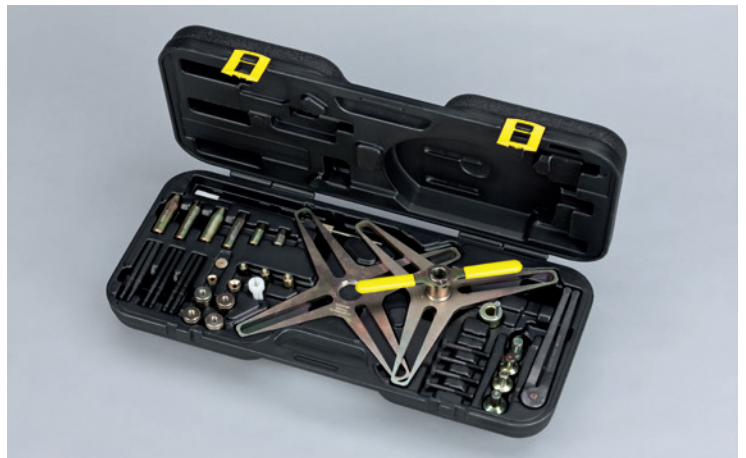
Photo 2 : L'outillage spécial réf.: 400 0237 10 permet de réparer l'embrayage de manière professionnelle

Respecter les préconisations du constructeur du véhicule!