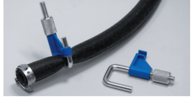
Resim 1: Hortum kelepçeleri

Doęru uygulanan prosedüre rağmen, filtre deęişiminden sonra rahatsız edici yan sesler oluşuyorsa bunun nedeni, yakıt besleme sistemindeki bir arıza olabilir. Hata analizi açısından önerilerimiz, yakıt pompasının, yakıt tankı hava boşaltımının ve ön filtrenin kontrolü olacaktır.