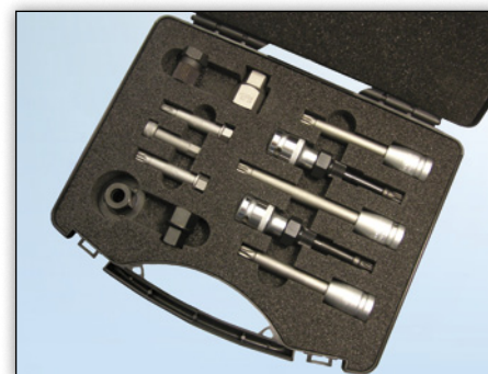
Photo 3: Outillage spécial INA Référence 400 0241 10