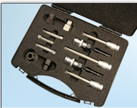
Photo 3 : Outils spéciaux INA réf.400 0241 10

Les deux poulies à roue libre d'alternateur répondent parfaitement aux exigences techniques, la seule différence étant leur aspect extérieur.