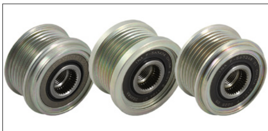
Fig. 2 : Poulies à roue libre d'alternateur réf.: 535 0063 10 (à gauche), réf. : 535 0202 10 (au milieu), réf. : 535 0203 10 (à droite)

Dans les véhicules équipés d'une poulie rigide désignés ci-dessus, il peut y avoir des vibrations et des bruits gênants provenant du système d'entraînement des accessoires périphériques. Ces derniers sont générés par des irrégularités cycliques plus importantes dans les moteurs diesel que dans les moteurs à essence.