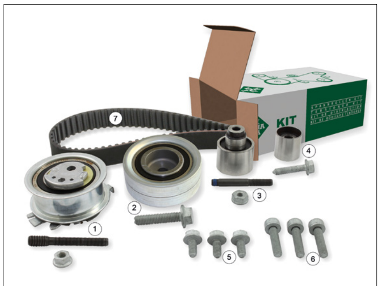
Photo 1 : kit de distribution INA réf. 530 0550 10

Tous les composants de la distribution sont conçus pour une durée de vie identique et sont soumis à la même usure.