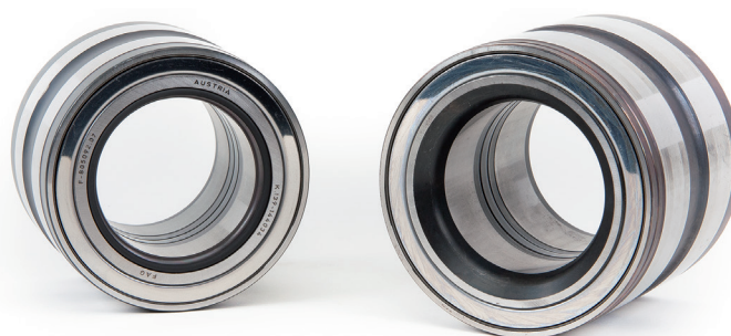
Photo 1 : Unité complète prémontée (THU) avec joint torique (à gauche) ou chant biseauté (à droite) au niveau de la bague intérieure

Il est important de respecter le sens du montage des modules de roulements mentionnés ci-dessus. Celui-ci résulte certes de la forme de la fusée d'essieu et de la bague intérieure du THU mais demande à être clarifié par la présente info technique.