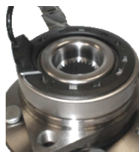
Rif. OE 96812719