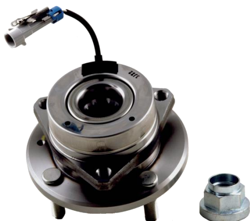
Ref. OE 96639585

Se impone un control visual para determinar el rodamiento que debe ser montado sobre el vehículo: El rodamiento con la envolvente metálica corresponde al kit R190.06.