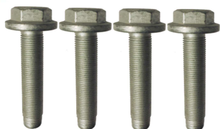
R159.64: Peugeot 308 II