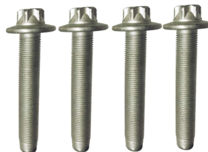
R159.65: Citroën C4 Picasso II